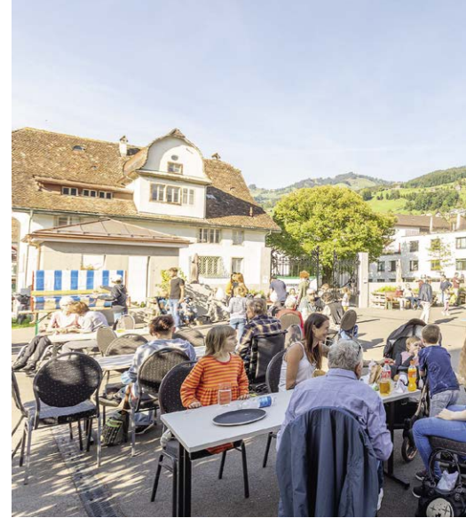
Acherhof-Chilbi für die Bewohner/-innen und Na