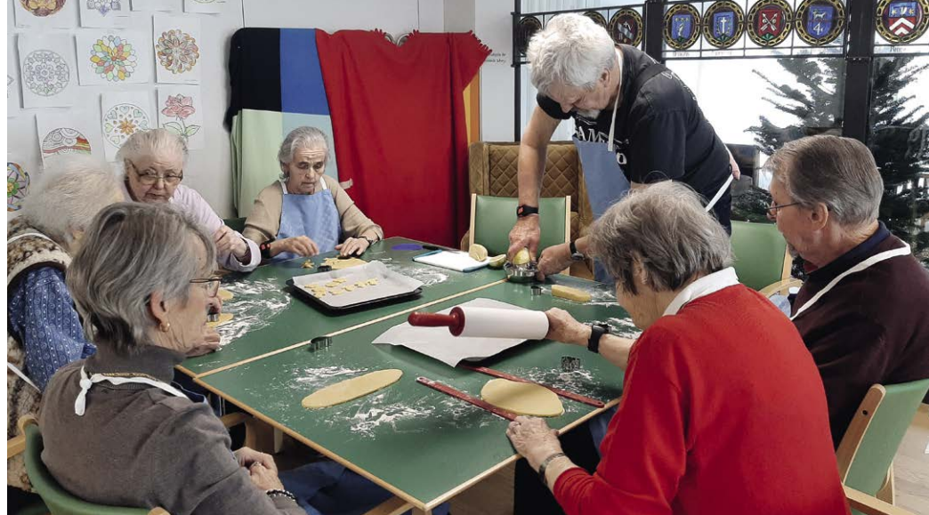
Während der Adventszeiten werden miteinander feine Guetzi gebacken.