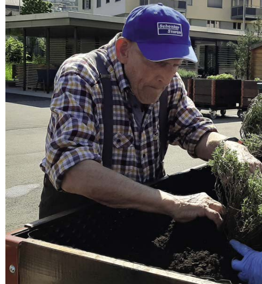
In den Hochbeeten, welche die Bewohnenden pflegen.