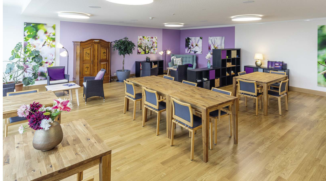
Aufenthaltsraum im Haus Franziskus.