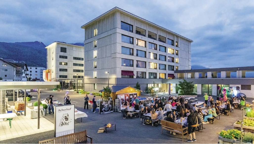
Gemeinsamer Grillabend auf der Acherhof-Piazza.