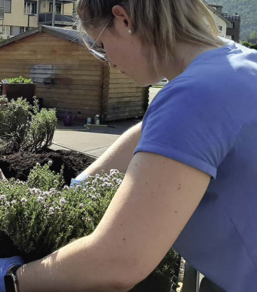
gen, wachsen u. a. Kräuter und Erdbeeren.