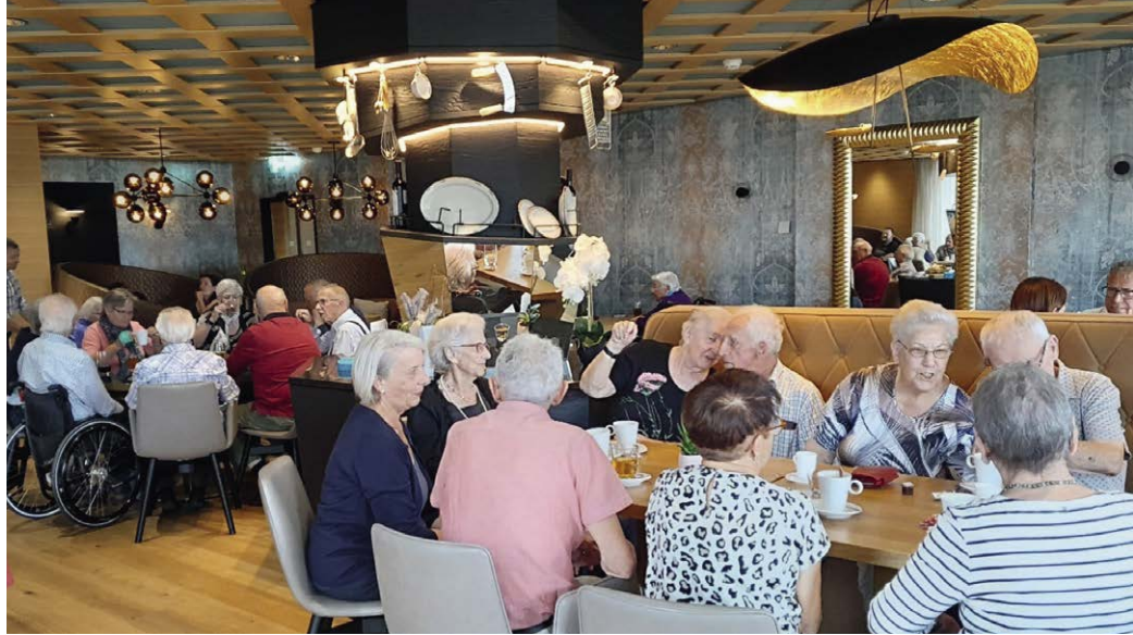
Gemütliches Zusammensein beim «Quartier-Kafi Acherhof» im Restaurant zum Acher.