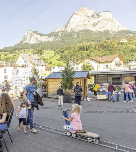
Kindern/-innen des Dorfquartiers.