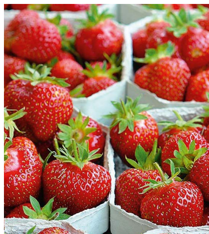
Liebs Mueti Ich hoffe, die Erdbeeren haben dir geschmeckt, die ich für dich abgeben habe. Ganz liebi Grüässli Jolanda