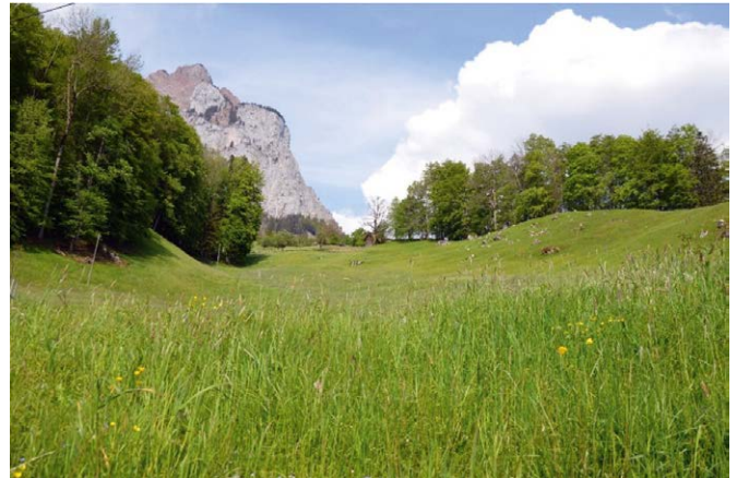
Gimmermee ob Rickenbach.

In Schwyz brachte früher der Tschütschi-Waldbruder die kleinen Kinder. Er holte sie unter der balmartigen Einbuchtung eines riesigen Steines hervor, der heute noch westlich der Tschütschi-Waldlichtung am Rand eines schmalen, wenig begangenen Wald-