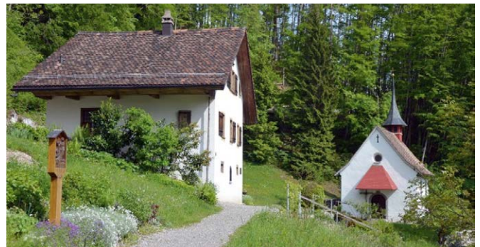
Einsiedelei Tschütschi ob Rickenbach.